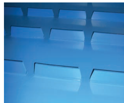
Perfiles biselados para trabajar en artesanía