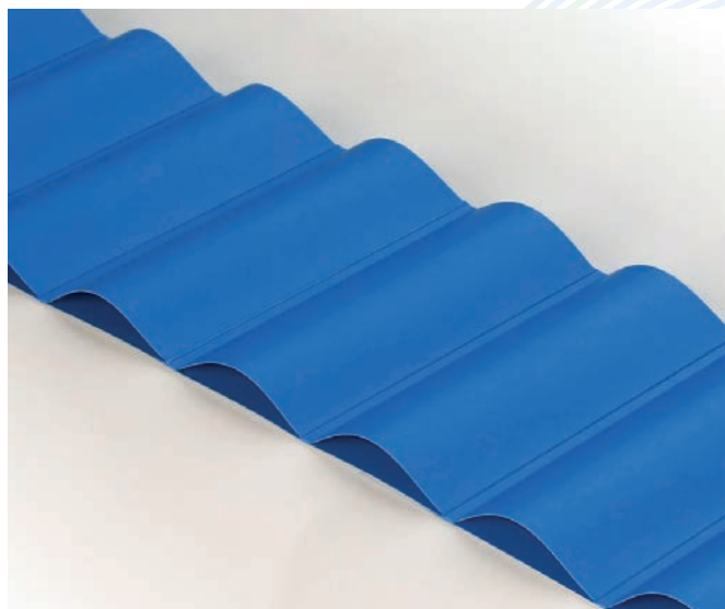
Banda con ondas de PU

Las ondas pueden ser colocadas de forma continua o discontinua, las soldamos con máquinas de alta frecuencia.