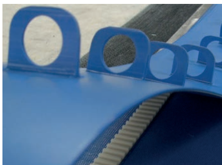
Tacos con perforaciones