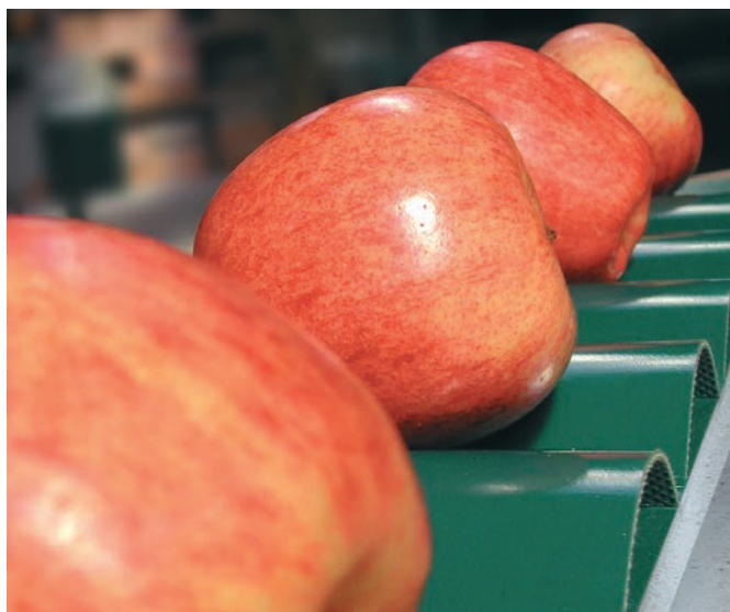
Banda con ondas de PVC

Las bandas de ondas amortiguan la caída de productos frágiles tipo frutas y verduras. Se pueden usar también para transportar piezas cilíndricas o de varias formas que requieren una inmovilización perfecta durante el transporte.