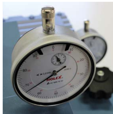
Réglage par comparateur au 1/100 mm