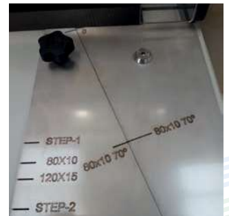
Einstellung für diagonale Fingerverbindung