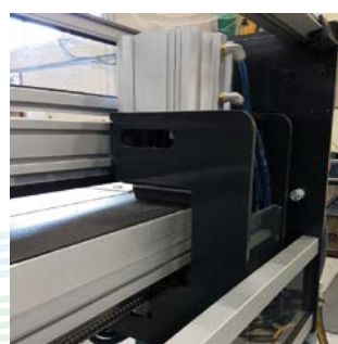
Changement de tête