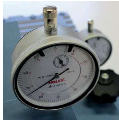
Kontrolle durch Messuhren (1/100 mm)