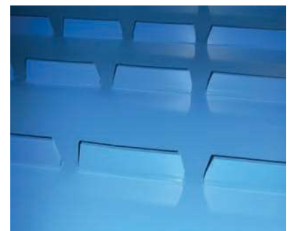
Stollen mit abgeschrägten Kanten für Muldenförderung